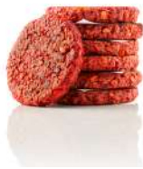
* SURGELE RED OAT BURGER VEGAN 110 G * 10 SALOMON