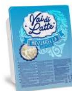
PRODUITS FRAIS FIOR DI LATTE BARQUETTE TAGLIO JULIENNE 2.5 KG VAI DI LATTE