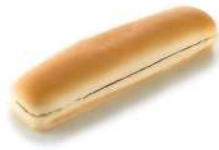
* SURGELE PAINS A HOT DOG PRE DECOUPES 20.5 CM 48P