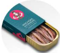
PRODUITS FRAIS ANCHOIS DE CANTABRIE FUMES HUILE OLIVE VIERGE EXTRA RR90 100 G C