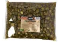
AMBIANT PIMENTS JALAPENOS EMINCES POCHES 3 KGS