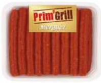
* SURGELE MERGUEZ ENVELOPPE VEGETALE SOCOPA 55 G