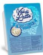
PRODUITS FRAIS FIOR DI LATTE BARQUETTE COUPE NAPOLI 2.5 KG VAI DI LATTE