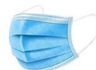
MATERIELS EMBALLAGES HYGIENE MASQUES DE PROTECTION M1/50 CERTIF CE