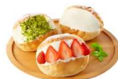
* SURGELE MARITOLLO AU BEURRE 45 G * 45