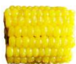
* SURGELE EPI DE MAIS EN TRONCON