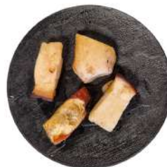
* SURGELE CEPES EN MORCEAUX SACHET DE 1 KG