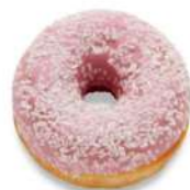
* SURGELE DONUTS FOURRES ET ENROBES FRAISE (36*76 GRS) Code: 405453