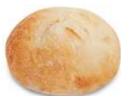
* SURGELE MINI PAIN NATURE ROND CUIT (65*45 GRS) Code: 412013