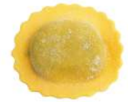
PRODUITS FRAIS DELIZIA HERBES ET PARMESAN 500 G SACHET FONTANETO