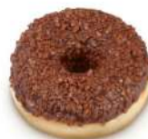
* SURGELE DONUTS ENROBES CHOCOLAT (36*55 GRS) Code: 405451