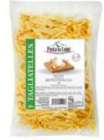
PRODUITS FRAIS TAGLIATELLES FRAICHES AUX OEUFS FRAIS 1 KG PASTA DI LUIGI