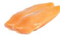
PRODUITS FRAIS FILET DE POULET FRAIS SS VIDE HALAL 2 KGS