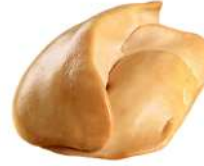
PRODUITS FRAIS FOIE GRAS CANARD CRU 1ER CHOIX DEVEINE FRANCAIS SARRADE