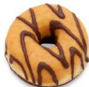
* SURGELE DONUTS FOURRES ET ENROBES CHOCOLAT (36*75 GRS) Code: 405452