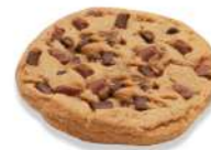
* SURGELE COOKIES CHOCOLAT LAIT (34*76 GRS) Code: 405456