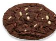
* SURGELE COOKIES TRIPLE CHOCOLAT (34*76 GRS) Code: 405457