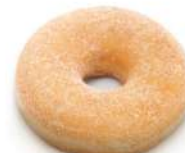
* SURGELE DONUTS SUCRES (48*65 GRS) Code: 405450