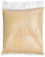
AMBIANT AMANDES BLANCHIES POUFRE 1 KG