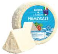
PRODUITS FRAIS PECORINO PRIMOSALE NATURALE FRAIS 1.5 KG