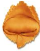
PRODUITS FRAIS TORTELLONE ALLA ZUCCA 1KG BARQ GRANCHEF