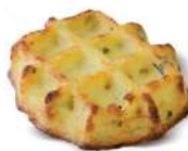
* SURGELE GAUFRE DE POMME DE TERRE (48*85 GRS) Code: 403311