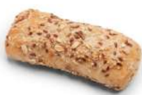
* SURGELE MINI PAIN AUX GRAINES CUIT (80*35 GRS) Code: 412012