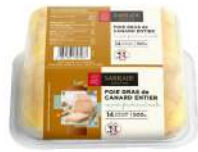
PRODUITS FRAIS FOIE GRAS CANARD ENTIER MI CUIT FRANCAIS AU POIVRE 500 G SARRAD