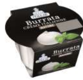
PRODUITS FRAIS BURRATA POT 100 GR Code: 101218