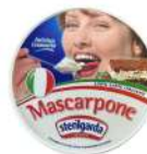
PRODUITS FRAIS MASCARPONE 500 GR Code: 102113