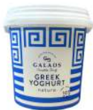
PRODUITS FRAIS YAOURT GREC 10% MG 1KG Code: 102110