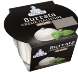
PRODUITS FRAIS BURRATA POT 100 GR Code: 101218