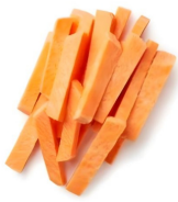
PRODUITS FRAIS PATATE DOUCE FRITES FRAICHES 1 KG Code: 104185