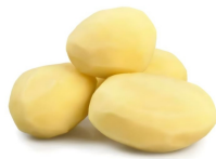
PRODUITS FRAIS POMME DE TERRE ENTIERE PELEE 1 KG Code: 104184