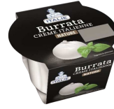
PRODUITS FRAIS BURRATA POT 120 GR Code: 101217