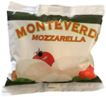
PRODUITS FRAIS MOZZARELLA BOULE 125 GR Code: 102116