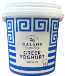
PRODUITS FRAIS YAOURT GREC 10% MG 1KG Code: 102110