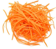
PRODUITS FRAIS CAROTTE RAPEE 500 GR Code: 104188