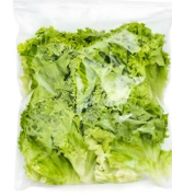
PRODUITS FRAIS LAITUE COUPEE 500 GR Code: 104187