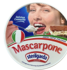
PRODUITS FRAIS MASCARPONE 500 GR Code: 102113