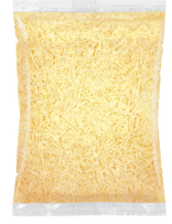
PRODUITS FRAIS MOZZARELLA RAPEE 2.5 KG Code: 101127