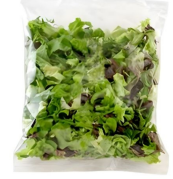
PRODUITS FRAIS MELANGE SALADES LOCALES 500 GR Code: 104186