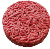
* SURGELE SH ROND VBF FACON BOUCH 180 GR *32 15% MG Code: 405114