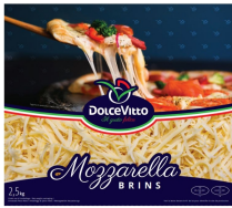
PRODUITS FRAIS MOZZARELLA RAPEE 40% DOLCEVITTO 2.5KG Code: 101119