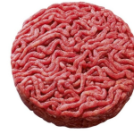
* SURGELE SH ROND VBF FACON BOUCH 150 GR *38 15% MG Code: 405113