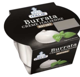
PRODUITS FRAIS BURRATA POT 100 GR Code: 101218