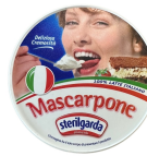
PRODUITS FRAIS MASCARPONE 500 GR Code: 102113