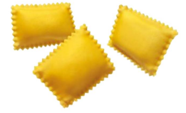
* SURGELE BAULETTI CEPES TALEGGIO AOP 2KG SURGITAL - GAMME DIVINE CREAZIONI Code: 407211