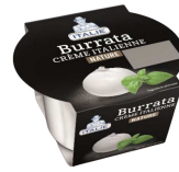
PRODUITS FRAIS BURRATA POT 120 GR Code: 101217