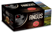
* SURGELE SH BOEUF ANGUS FACON BOUCH 20 % MG 20*150GRS Code: 405111