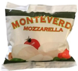
PRODUITS FRAIS MOZZARELLA BOULE 125 GR Code: 102116