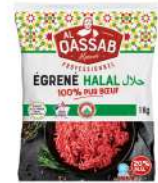
SURGELE EGRENE PUR BOEUF VBF 20% MG HALAL Code: 405112