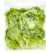
PRODUITS FRAIS LAITUE COUPEE 500 GR Code: 104187