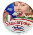
PRODUITS FRAIS MASCARPONE 500 GR Code: 102113