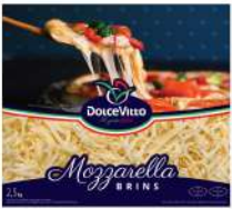
PRODUITS FRAIS MOZZARELLA RAPEE 40% DOLCEVITTO 2.5KG Code: 101119