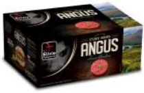
* SURGELE SH BOEUF ANGUS FACON BOUCH 20 % MG 20*150GRS Code: 405111