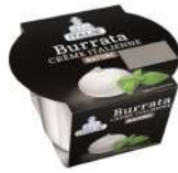
PRODUITS FRAIS BURRATA POT 100 GR Code: 101218