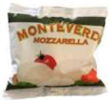
PRODUITS FRAIS MOZZARELLA BOULE 125 GR Code: 102116