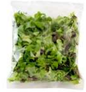
PRODUITS FRAIS MELANGE SALADES LOCALES 500 GR Code: 104186