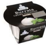
PRODUITS FRAIS BURRATA POT 120 GR Code: 101217