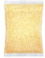
PRODUITS FRAIS MOZZARELLA RAPEE 2.5 KG Code: 101127