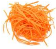
PRODUITS FRAIS CAROTTE RAPEE 500 GR Code: 104188