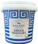
PRODUITS FRAIS YAOURT GREC 10% MG 1KG Code: 102110