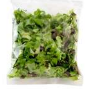
PRODUITS FRAIS MELANGE SALADES LOCALES 500 GR Code: 104186