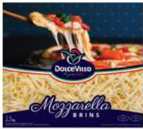
PRODUITS FRAIS MOZZARELLA RAPEE 40% DOLCEVITTO 2.5KG Code: 101119