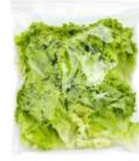
PRODUITS FRAIS LAITUE COUPEE 500 GR Code: 104187