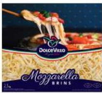
PRODUITS FRAIS MOZZARELLA RAPEE 40% DOLCEVITTO 2.5KG Code: 101119