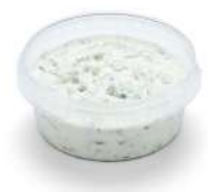
PRODUITS FRAIS TZATZIKI AU YAOURT GREC 1KG Code: 104222