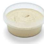
PRODUITS FRAIS HOUMOUS AUTHENTIQUE 420 GR Code: 104223