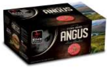
* SURGELE SH BOEUF ANGUS FACON BOUCH 20 % MG 20*150GRS Code: 405111