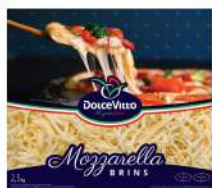
PRODUITS FRAIS MOZZARELLA RAPEE 40% DOLCEVITO 2.5KG Code: 101119