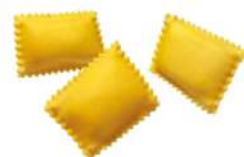
* SURGELE BAULETTI CEPES TALEGGIO AOP 2KG SURGITAL - GAMME DIVINE CREAZIONI Code: 407211