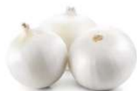
PRODUITS FRAIS OIGNON PELEE 1 KG Code: 104199