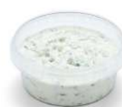
PRODUITS FRAIS TZATZIKI AU YAOURT GREC 1KG Code: 104222