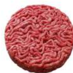
* SURGELE SH ROND VBF FACON BOUCH 150 GR *38 15% MG Code: 405113