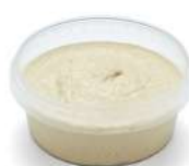
PRODUITS FRAIS HOUMOUS AUTHENTIQUE 420 GR Code: 104223