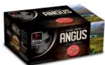
* SURGELE SH BOEUF ANGUS FACON BOUCH 20 % MG 20*150GRS Code: 405111