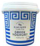
PRODUITS FRAIS YAOURT GREC 10% MG 1KG Code: 102110