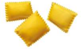
* SURGELE BAULETTI CEPES TALEGGIO AOP 2KG SURGITAL - GAMME DIVINE CREAZIONI Code: 407211