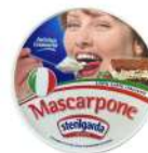
PRODUITS FRAIS MASCARPONE 500 GR Code: 102113