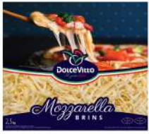
PRODUITS FRAIS MOZZARELLA RAPEE 40% DOLCEVITTO 2.5KG Code: 101119