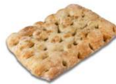
SURGELE FOCACCIA SEL MARIN ET ROMARIN 400 GR (29*18*3.5) Code: 408009