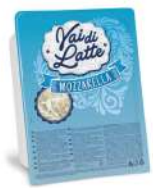
PRODUITS FRAIS FIOR DI LATTE BARQUETTE TAGLIO JULIENNE 2.5 KG VAI DI LATTE