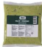
SURGELE PULPE D'AVOCAT SACHET 1 KG Code: 906721