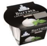
PRODUITS FRAIS BURRATA POT 120 GR