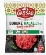
SURGELE EGRENE PUR BOEUF VBF 20% MG HALAL