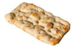
SURGELE PINSA ROMANA 230 GR * 12 Code: 408008