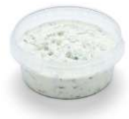
PRODUITS FRAIS TZATZIKI AU YAOURT GREC 1KG Code: 104222