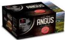
SURGELE SH BOEUF ANGUS FACON BOUCH 20 % MG 20*150GRS