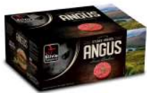
SURGELE SH BOEUF ANGUS FACON BOUCH 20 % MG 20*150GRS