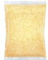
PRODUITS FRAIS MOZZARELLA RAPEE 2.5 KG