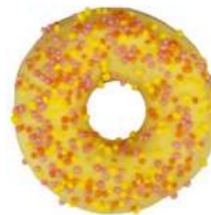
* SURGELE DONUT MANGUE ET FOURRAGE CREMEUX (36*70 GRS)