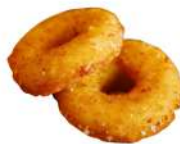
* SURGELE MINI DONUTS AU CHEVRE (? 17 PIECES) 600 GRS