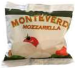
PRODUITS FRAIS MOZZARELLA BOULE 125 GR Code: 102116