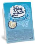
PRODUITS FRAIS FIOR DI LATTE BARQUETTE TAGLIO JULIENNE 2.5 KG VAI DI LATTE