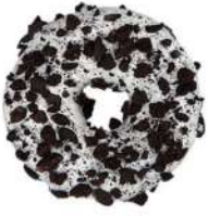
SURGELE DONUT COOKIE ET FOURRAGE CREMEUX (36*75 GRS)