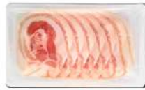
PRODUITS FRAIS PANCETTA STAGIONATA TRANCHE 500 GRS (25 TRANCHES) AZZOLA