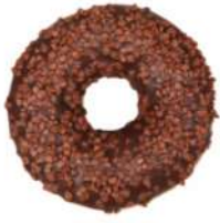
* SURGELE DONUT NOISETTE ET FOURRAGE CREMEUX (36*71 GRS)