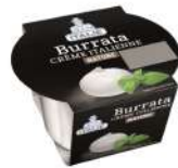
PRODUITS FRAIS BURRATA POT 100 GR