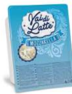
PRODUITS FRAIS FIOR DI LATTE BARQUETTE COUPE NAPOLI 2.5 KG VAI DI LATTE