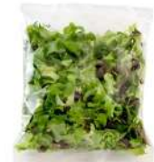
PRODUITS FRAIS MELANGE SALADES LOCALES 500 GR Code: 104186