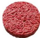
SURGELE SH ROND VBF FACON BOUCH 180 GR *32 15% MG