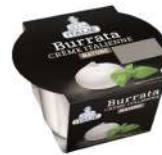
PRODUITS FRAIS BURRATA POT 120 GR