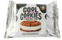
* SURGELE COOKIE CHOCOLAT & GLACE VANILLE (24*120 GRS)