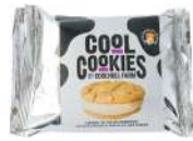
* SURGELE COOKIE CHOCOLAT BLANC & GLACE CARAMEL (24*120 GRS)