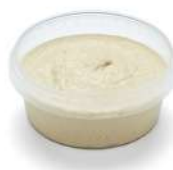
PRODUITS FRAIS HOUMOUS AUTHENTIQUE 420 GR Code: 104223