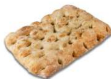
* SURGELE FOCACCIA SEL MARIN ET ROMARIN 400 GR (29*18*3.5) Code: 408009