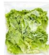
PRODUITS FRAIS LAITUE COUPEE 500 GR Code: 104187