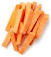
PRODUITS FRAIS PATATE DOUCE FRITES FRAICHES 1 KG