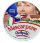
PRODUITS FRAIS MASCARPONE 500 GR Code: 102113