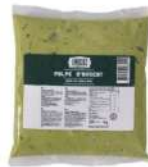
SURGELE PULPE D'AVOCAT SACHET 1 KG Code: 906721