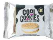
* SURGELE COOKIE CHOCOLAT BLANC & GLACE VANILLE (24*120 GRS)