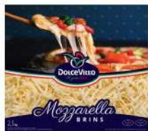
PRODUITS FRAIS MOZZARELLA RAPEE 40% DOLCEVITTO 2.5KG Code: 101119