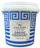
PRODUITS FRAIS YAOURT GREC 10% MG 1KG Code: 102110