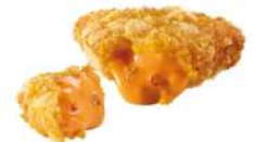
* SURGELE NACHOS CHEDDAR TRIANGLE (? 24 PIECES) 500 GRS