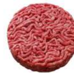
SURGELE SH ROND VBF FACON BOUCH 150 GR *38 15% MG