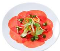
* SURGELE CARPACCIO DE BOEUF CHARAL VBF 70GR * 20 ASSIETTES Code: 400511