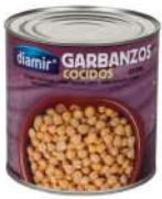
AMBIANT POIS CHICHES CALIBRE 29/30 (? 1.6 KGS NET EGOUTE) CONSERVE 3/1