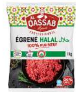
SURGELE EGRENE PUR BOEUF VBF 20% MG HALAL