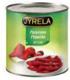
AMBIANT POIVRON PIQUILLO CALIBRE 80/100 (? 1.9 KGS NET EGOUTE) 3/1