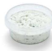
PRODUITS FRAIS TZATZIKI AU YAOURT GREC 1KG Code: 104222