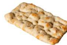
* SURGELE PINSA ROMANA 230 GR * 12 Code: 408008