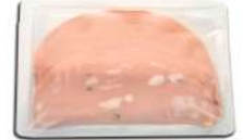
PRODUITS FRAIS MORTADELLE TRANCHE 500 GRS (30 TRANCHES) (Ø 15 CM) AZZOLA