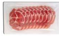
PRODUITS FRAIS COPPA STAGIONATA TRANCHE 500 GRS (35 TRANCHES) (Ø 10 CM) AZZOLA