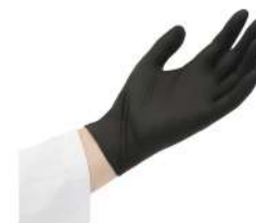
MATERIELS EMBALLAGES HYGIENE GANTS NOIRS TAILLE S NITRILE NON POUDRES /100 Code: 302265