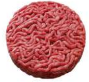
* SURGELE SH ROND VBF FACON BOUCH 180 GR *32 15% MG