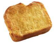
* SURGELE BRIOCHE PERDUE PRETRANCHEE 12 *85 GR