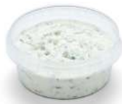
PRODUITS FRAIS TZATZIKI AU YAOURT GREC 1KG