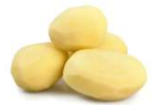
PRODUITS FRAIS POMME DE TERRE ENTIERE PELEE 1 KG