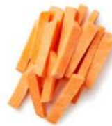
PRODUITS FRAIS PATATE DOUCE FRITES FRAICHES 1 KG