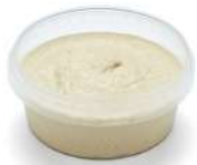
PRODUITS FRAIS HOUMOUS AUTHENTIQUE 420 GR