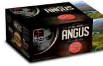
* SURGELE SH BOEUF ANGUS FACON BOUCH 20 % MG 20*150GRS