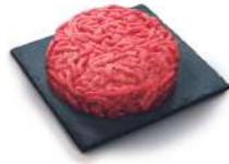
SURGELE STEAK HACHE ROND VBF FACON BOUCHERE 15% MG 125GR *48