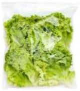
PRODUITS FRAIS LAITUE COUPEE 500 GR Code: 104187