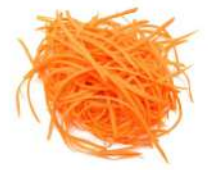
PRODUITS FRAIS CAROTTE RAPEE 500 GR Code: 104188