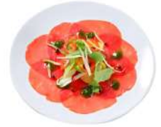
* SURGELE CARPACCIO DE BOEUF CHARAL VBF 70GR * 20 ASSIETTES Code: 400511