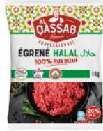
* SURGELE EGRENE PUR BOEUF VBF 20% MG HALAL