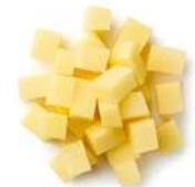
PRODUITS FRAIS POMMES DE TERRE CUBES 10X10 2.5 KGS