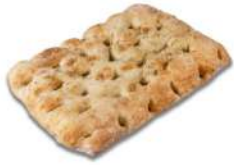
* SURGELE FOCACCIA SEL MARIN ET ROMARIN 400 GR (29*18*3.5) Code: 408009