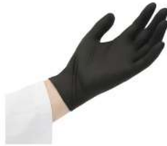
MATERIELS EMBALLAGES HYGIENE GANTS NOIRS TAILLE S NITRILE NON POUDRES /100 Code: 302265