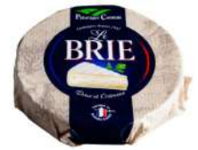
PRODUITS FRAIS BRIE 1KG 60% MG Code: 101418