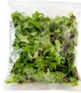
PRODUITS FRAIS MELANGE SALADES LOCALES 500 GR