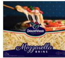
PRODUITS FRAIS MOZZARELLA RAPEE 40% DOLCEVITTO 2.5KG