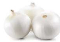
PRODUITS FRAIS OIGNON PELE 1 KG