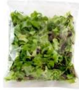
PRODUITS FRAIS MELANGE SALADES LOCALES 500 GR