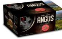
* SURGELE SH BOEUF ANGUS FACON BOUCH 20 % MG 20*150GRS