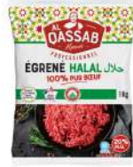
* SURGELE EGRENE PUR BOEUF VBF 20% MG HALAL