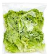
PRODUITS FRAIS LAITUE COUPEE 500 GR Code: 104187