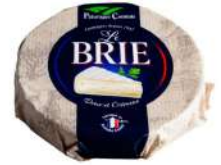
PRODUITS FRAIS BRIE 1KG 60% MG Code: 101418