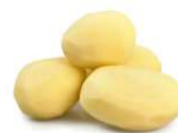
PRODUITS FRAIS POMME DE TERRE ENTIERE PELEE 1 KG