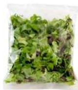
PRODUITS FRAIS MELANGE SALADES LOCALES 500 GR