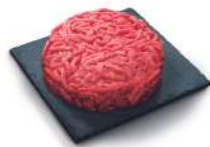
SURGELE STEAK HACHE ROND VBF FACON BOUCHERE 15% MG 125GR *48