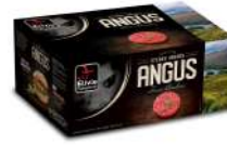
* SURGELE SH BOEUF ANGUS FACON BOUCH 20 % MG 20*150GRS