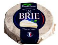
PRODUITS FRAIS BRIE 1KG 60% MG Code: 101418