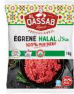
* SURGELE EGRENE PUR BOEUF VBF 20% MG HALAL