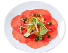
* SURGELE CARPACCIO DE BOEUF CHARAL VBF 70GR * 20 ASSIETTES Code: 400511