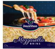
PRODUITS FRAIS MOZZARELLA RAPEE 40% DOLCEVITTO 2.5KG