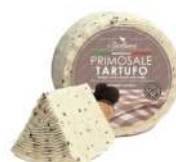
PRODUITS FRAIS PECORINO PRIMOSALE FRAIS TRUFFE 800 GR