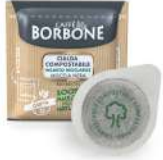
AMBIANT CAFE BLACK PODS X 150 BORBONE