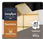
PRODUITS FRAIS RACLETTE TRANCHE 800 GR (36 TRANCHES)