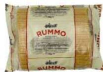
AMBIANT LINGUINE N°13 RUMMO 3 KG