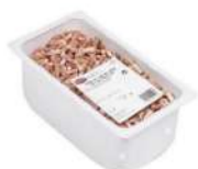
PRODUITS FRAIS LARDONS CRUS SALES 5*5. 1 KG Code: 103205