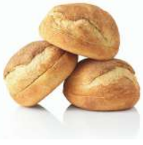
SURGELE HOMESTYLE BURGER BUN 105 G*36