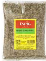
AMBIANT HERBES DE PROVENCE 1 KG SACHET ESPIG