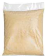
AMBIANT AMANDES BLANCHIES POWDRE 1 KG Code: 204128