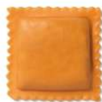
PRODUITS FRAIS QUADRONE ALLA ZUCCA 500 G FONTANETO