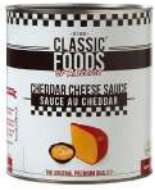
AMBIANT CHEDDAR CHEESE SAUCE 3 KGS Code: 806878