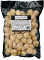
SURGELE MINI CROQUETAS BOEUF SECHE PIMENT 12- 14 G * 72