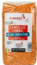
AMBIANT LENTILLES CORAIL 1 KG SABAROT Code: 203057