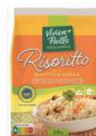
AMBIANT RIZ ETUVE SPECIAL RISOTTO 2.5 KG