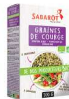
AMBIANT GRAINES DE COURGE BIO 500 GRS SABAROT Code: 203053