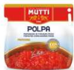
AMBIANT PULPE FINE BIB 2*5 KGS MUTTI Code: 201115