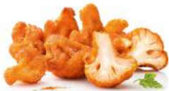
SURGELE BEIGNETS DE CHOU FLEUR CAULI WINGS 1KG