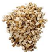
AMBIANT NOISETTES HACHEES GRILLEES 1KG Code: 204118