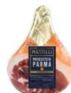
PRODUITS FRAIS JAMBON DE PARME S/OS MARTELLI Code: 103412