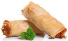
SURGELE NEM AU PORC 2*50P Code: 904873