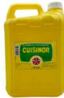
AMBIANT CUISINOR 5 L HUILE DE FRITURE