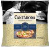
PRODUITS FRAIS MOZZARELLA COSSETTE (45% MG) 2.5 KGS CANTADORA