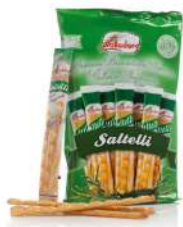
AMBIANT GRESSINS ROMARIN 240 GR SALTELLI