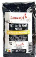
AMBIANT RIZ NOIR 950 GRS SABAROT Code: 203048