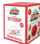
AMBIANT SAUCE KETCHUP DOSETTES BOITE DISTRIBUTRICE (100*10 ML) GYMA