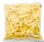
SURGELE TAGLIATELLE OEUF PRECUIT MONO PORT. IQF 12*250