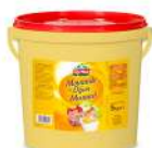
AMBIANT MOUTARDE DE DIJON SEAU 5 L GYMA