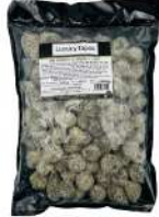
SURGELE MINI CROQUETAS CHIPIRONS A L ENCRE 12- 14 G * 72