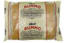
AMBIANT SPAGHETTI N°5 RUMMO 3 KGS Code: 203028