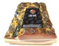
PRODUITS FRAIS SORFUME 3.2 KGS SORRENTINO