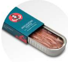
PRODUITS FRAIS ANCHOIS DE CANTABRIE A L'HUILE D'OLIVE VIERGE EXTRA 50 CM