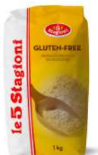
AMBIANT MIX GLUTEN FREE 1 KG