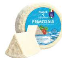
PRODUITS FRAIS PECORINO PRIMOSALE NATURALE FRAIS 1.5 KG