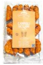
AMBIANT CANNOLINI SICILIENS MIGNONS *16 Code: 208232