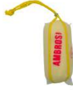
PRODUITS FRAIS PROVOLONE DOUX 800 GR Code: 101237