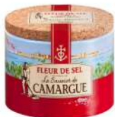
AMBIANT FLEUR DE SEL CAMARGUE 125 GRS