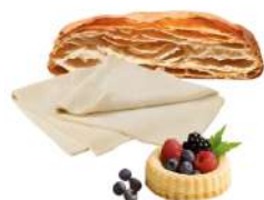
SURGELE PATE FEUILLETEE PLAQUE 4 LOTS DE 4 * 625 G