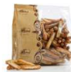
AMBIANT PETITS GRESSINS AU PESTO 300 GR VALLEDORO