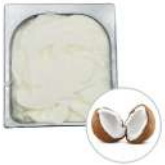
* SURGELE CREME GLACEE NOIX DE COCO 2.5 L MD Code: 411303