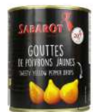
AMBIANT GOUTTES DE POIVRONS JAUNE 4/4 SABAROT Code: 201826