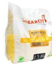
AMBIANT POLENTA EXPRESS 2.5 KG SABAROT Code: 203059