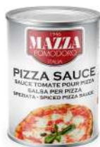
AMBIANT SAUCE PIZZA AROMATISEE 5/1 MAZZA Code: 201132