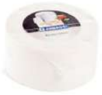
PRODUITS FRAIS RICOTTA SALÉ 3 KGS ENVIRON Code: 101281