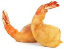
* SURGELE BEIGNETS DE CREVETTES SACHETS DE 500 GRS