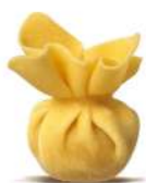
PRODUITS FRAIS SACCOTTINO AU JAMBON CRU 1KG SF FONTANETO