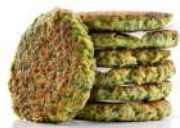
SURGELE GREEN OAT BURGER 1.10 KG SALOMON