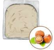
* SURGELE CREME GLACEE NOISETTE 2.5 L MD Code: 411139