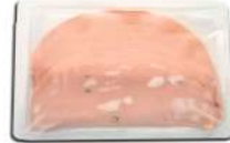
PRODUITS FRAIS MORTADELLE TRANCHE 500 GRS (30 TRANCHES) (Ø 15 CM) AZZOLA