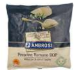
PRODUITS FRAIS PECORINO ROMANO DOP RAPE 500 GR