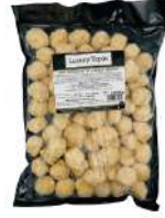
SURGELE MINI CROQUETAS JAMBON IBERIQUE 12- 14 G * 72