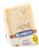
PRODUITS FRAIS GRANA PADANO 1 KG Code: 101211