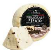
PRODUITS FRAIS PECORINO PRIMOSALE PEPATO FRAIS 1.5 KG