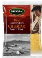
PRODUITS FRAIS CHEDDAR ROUGE RAPE 1 KG Code: 101605