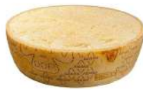
PRODUITS FRAIS GRANA PADANO DOP 1/2 MEULE Code: 101267