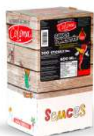
AMBIANT SAUCE PIMENTEE EXTRA FORTE DOSETTES BOITE SERVICE 4 * 200 Code: 204306