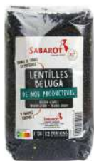
AMBIANT LENTILLES BELUGA NOIRES 1 KG SABAROT Code: 203060