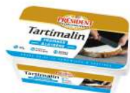
PRODUITS FRAIS TARTIMALIN CREAM CHEESE PRESIDENT 1 KG Code: 101423