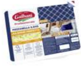
PRODUITS FRAIS MOZZARELLA RAPEE PERFETTA (45% MG) 2.5 KGS GALBANI