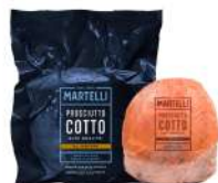
PRODUITS FRAIS JAMBON 1/2 CUIT A LA TRUFFE MARTELLI Code: 103413