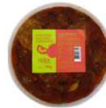
PRODUITS FRAIS TOMATES SECHES ANTIPASTI 1KG Code: 104213