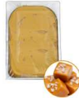
* SURGELE CREME GLACEE CAMEL BEURRE SALE 5 L MENODICIOTTO Code: 411355