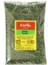
AMBIANT PERSIL FLOCONS 500 GR SACHET ESPIG