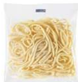
SURGELE SPAGHETTI PRECUIT MONO PORT. IQF 12*250 G