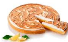
* SURGELE TARTE CITRON MERINGUEE 1KG BONCOLAC