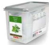
AMBIANT ORIGAN SÈCHÉ WIBERG 7900 ML