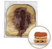
* SURGELE CREME GLACEE TIRAMISU 2.5 L MD Code: 411352