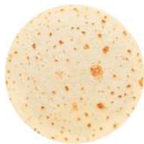
AMBIANT TORTILLAS DE MAIS 12 CM 20 SACHETS DE 30