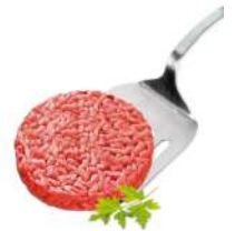
PRODUITS FRAIS STEAK HACHE CHAROLAIS ROND FACON BOUCHERE (8*150 GRS) VBF SOCOPA Code: 105422