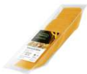
PRODUITS FRAIS CHEDDAR ROUGE 66 TRANCHES 9*9 1KG Code: 101610