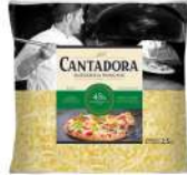
PRODUITS FRAIS MOZZARELLA RAPEE (45% MG) 2.5 KGS CANTADORA