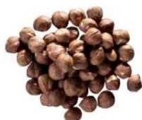
AMBIANT NOISETTES ENTIERES DECORTIQUEES 1KG Code: 204119