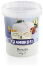
PRODUITS FRAIS BURRATA AMB. POT 200 GR Code: 101261