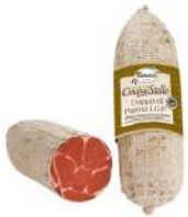
PRODUITS FRAIS COPPA DE PARME IGP KG Code: 103403