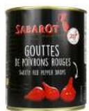
AMBIANT GOUTTES DE POIVRONS ROUGE 4/4 SABAROT Code: 201825