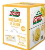
AMBIANT MOUTARDE DE DIJON 250 * 4 GR DOSETTES GYMA