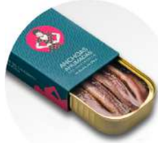
PRODUITS FRAIS ANCHOIS DE CANTABRIE FUMES HUILE OLIVE VIERGE EXTRA RR90 100 G C