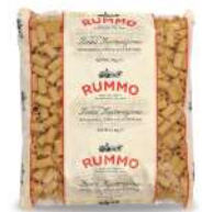
AMBIANT MEZZI RIGATONI N°51 3 KGS RUMMO