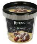
PRODUITS FRAIS PUREE D'AIL 1KG Code: 108007