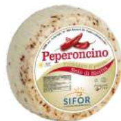
PRODUITS FRAIS PECORINO FRAIS PIMENT 1 KG ENVIRON