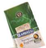
PRODUITS FRAIS PARMIGIANO REGGIANO MEZZANO 1 KG