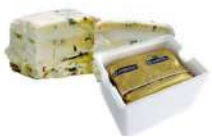
PRODUITS FRAIS GORGONZOLA MASCARPONE DOP 1.2 KG AMBROSI