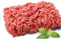
PRODUITS FRAIS HACHE TRADITION (15 % MG) 1.5 KGS VBF SOCOPA Code: 105460