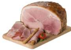
PRODUITS FRAIS JAMBON 1/2 CUIT HERBES FIORUCCI Code: 103416