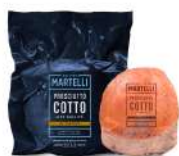
PRODUITS FRAIS JAMBON 1/2 CUIT A LA TRUFFE ENTIERE (? 4.3 KGS) MARTELLI Code: 103415