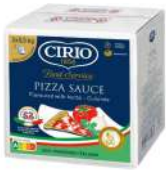
AMBIANT PIZZA SAUCE CIRIO BBOX 2*5.5 KG