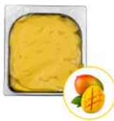
* SURGELE SORBET MANGUE 2.5 L MD Code: 411304