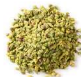
AMBIANT PISTACHE HACHEE 1 KG Code: 204113