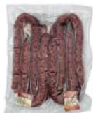
PRODUITS FRAIS CHORIZO COURBE FORT 280GR S/3KG LOZA