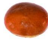
SURGELE PAIN BUNS GOURMET (Ø 10.5 CM) (2*15 PIECES) 96 GRs Code: 907018