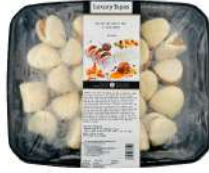
SURGELE BAO JOUES DE PORC 30 G * 24