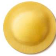
PRODUITS FRAIS DELIZIA CITRON 1KG BARQ GRANCHEF