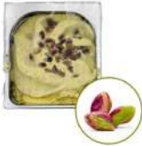
* SURGELE CREME GLACEE PISTACHE DE SICILE 2.5 L MD Code: 411136