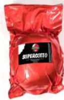
PRODUITS FRAIS JAMBON CUIT SUPERCOTTO SORRENTINO