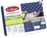
PRODUITS FRAIS MOZZARELLA CUBETTI (45% MG) 2.5 KGS GALBANI