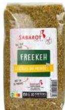
AMBIANT FREEKEH - BLE VERT FUME 850 GRS SABAROT Code: 203050