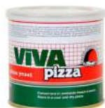
AMBIANT VIVA PIZZA LEVURE DESY 500 GRS