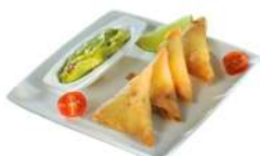
* SURGELE CROUSTILLANT DE POULET FAJITAS (108*18 GRS) AMIGOS