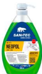
MATERIELS EMBALLAGES HYGIENE NEOPOL VAISSELLE MAIN CITRON 1L ULTRA DEGRAIS. Code: 303123