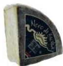
PRODUITS FRAIS NERO DI SICILIA PECORINO SEMISTAGIONATO 1/4 3.8 KG