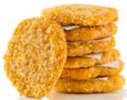
SURGELE MAC N CHEESE BURGER 130 G * 10 SALOMON