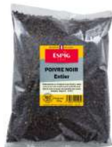
AMBIANT POIVRE NOIR ENTIER 500 GR SACHET ESPIG