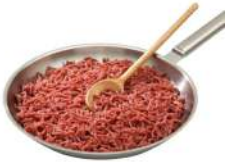
SURGELE EGRENE PUR BŒUF (15% MG) 1KG UE SOCOPA Code: 401151