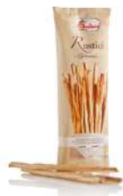
AMBIANT GRESSINS RUSTIQUES RESTAU. 240 GR