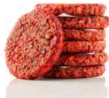
SURGELE RED OAT BURGER VEGAN 110 G * 10 SALOMON