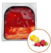
* SURGELE SORBET LAMPONCELLO FRAMB CITRON 2.5L MD Code: 411350