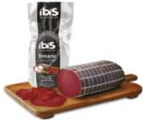
PRODUITS FRAIS BRESAOLA PUNTA D'ANCA 1.8 KG