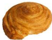
SURGELE PAIN BUN CROISSANT BRIOCHE NON TRANCHE (Ø 11 CM) (40 *65 GRs) Code: 907849