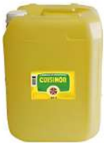
AMBIANT CUISINOR 20 L HUILE DE FRITURE