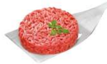
PRODUITS FRAIS STEAK HACHE ROND FACON BOUCHERE (8*150 GRS) VBF HALAL SOCOPA Code: 105468