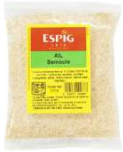
AMBIANT AIL SEMOULE 500 GR SACHET ESPIG