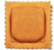
PRODUITS FRAIS QUADRONE CREVETTE CITRON PIMENT 1 KG BARQ GRANCHEF