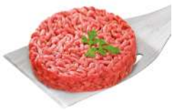
SURGELE STEAK HACHE FACON BOUCHERE (15% MG) (40*150 GRS) UE Code: 401150