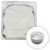
* SURGELE CREME GLACEE FIOR DI PANNA (LATTE) 2.5 L MD Code: 411140