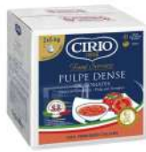
AMBIANT PULPE DENSE TOMATES BBOX 10 KG (2*5) CIRIO