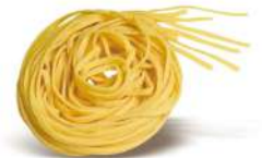
PRODUITS FRAIS TAGLIONI 1 KG BARQ GRANCHEF