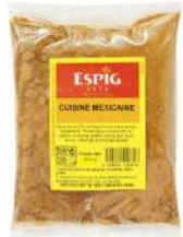
AMBIANT EPICES TEX MEX 240 GR POT ESPIG