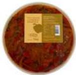
PRODUITS FRAIS POIVRONS LANIERES ANTIPASTI 1KG Code: 104216