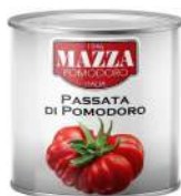
AMBIANT PASSATA – PUREE DE TOMATES ITALIENNES 3/1 MAZZA Code: 201102