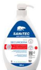
MATERIELS EMBALLAGES HYGIENE SAVON LIQUIDE MAINS BACTERICIDE 1000 ML Code: 303118