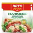
AMBIANT SAUCE PIZZA AROMATISEE BIB 2*5 KGS MUTTI Code: 201117