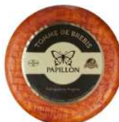
PRODUITS FRAIS TOMME DE BREBIS 4.5KG PAPILLON Code: 101519