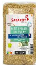
AMBIANT PETIT EPEAUTRE DU VELAY 1KG SABAROT Code: 203051