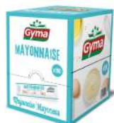
AMBIANT MAYONNAISE 100 * 10 ML DOSETTES GYMA