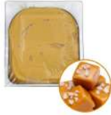
* SURGELE CREME GLACEE CAMEL BEURRE SALE 2.5 L MD Code: 411143