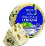
PRODUITS FRAIS PECORINO PRIMOSALE FRAIS FANTASIA 800 GR