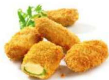
* SURGELE JALAPENO VERT AU CHEDDAR 6 X 1 KG