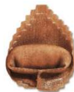
PRODUITS FRAIS TORTELLONE À LA TRUFFE 1KG SF FONTANETO