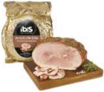
PRODUITS FRAIS JAMBON CUIT AUX HERBES 8 KGS