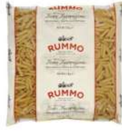
AMBIANT PENNE RIGATE N° 66 RUMMO 3 KG Code: 203021