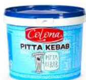
AMBIANT PITTA SPEC. KEBAB SAUCE 5 L Code: 205208