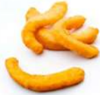
* SURGELE RABAS D'ENCORNET PANES 1 KG