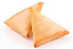
SURGELE SAMOUSSA AUX LEGUMES 100 PIECES Code: 906757