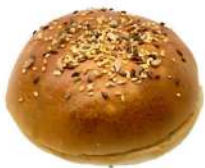
SURGELE BUNS GOURMETS MULTIGRAINS DIAM 10.8 CM (30PAINS) Code: 907064