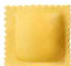
PRODUITS FRAIS QUADRONE AUX CHAMPIGNONS 500 G ATM FONTANETO