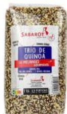
AMBIANT TRIO DE QUINOA 1KG SABAROT Code: 203049