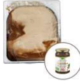
* SURGELE CREME GLACEE NOCCIOLATA 2.5 L MD Code: 411353