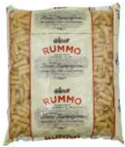
AMBIANT ELICOIDALI N° 49 RUMMO 3 KG