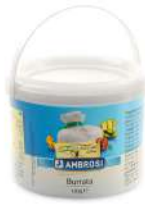
PRODUITS FRAIS BURRATINA AMB. POT 120 G Code: 101201