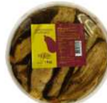
PRODUITS FRAIS AUBERGINES GRILLEES ANTIPASTI 1KG Code: 104218