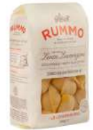
AMBIANT CONCHIGLIONI RIGATI N°147. 500 G RUMMO