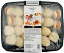
SURGELE BAO CREVETTES CURRY CITRONNE 30 G * 24