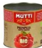
AMBIANT PULPE DE TOMATES BIO MORCEAUX 3/1 MUTTI