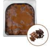
* SURGELE CREME GLACEE CHOCOLAT 2.5 L MD Code: 411134