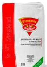
AMBIANT PIZZASOJA 10 KGS 5 STAGIONI