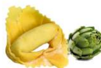
PRODUITS FRAIS TORTELLONE ARTICHAUTS 1 KG BARQ FONTANETO