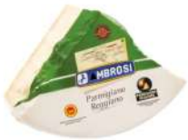
PRODUITS FRAIS PARMIGIANO REGGIANO 20 MOIS 1/8