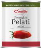
AMBIANT TOMATES PELEES 3/1 CASILLO Code: 201128