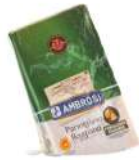
PRODUITS FRAIS PARMIGIANO REGGIANO 24 MOIS BLOC (? 1 KG) DOP AMBROSI