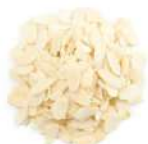
AMBIANT AMANDES EFFILEES BLANCHIES 1 KG Code: 204116