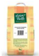
AMBIANT COUSCOUS MOYEN PRECUIT 5 KGS VIVIEN PAILLE