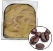
* SURGELE CREME GLACEE CAFE 2.5 L MD Code: 411137