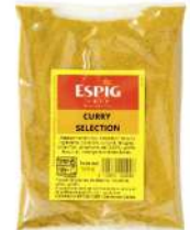
AMBIANT CURRY SELECT 1 KG SACHET ESPIG