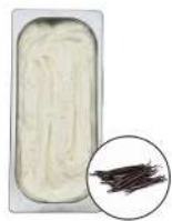
* SURGELE CREME GLACEE VANILLE MADAGASCAR 5 L MD