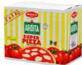
AMBIANT PULPE SUPER PIZZA BIB 2*5 KG Code: 201122