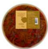
PRODUITS FRAIS POIVRONS LANIERES ANTIPASTI 1KG Code: 104216