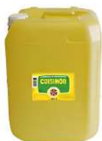
AMBIANT CUISINOR 20 L HUILE DE FRITURE Code: 204309