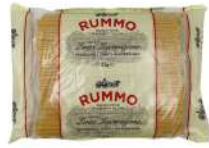
AMBIANT SPAGHETTI N°5 RUMMO 3 KGS Code: 203028