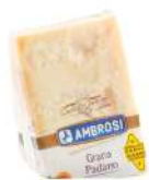
PRODUITS FRAIS GRANA PADANO 1 KG Code: 101211