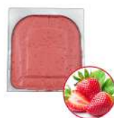
* SURGELE SORBET FRAISE 2.5 L MD