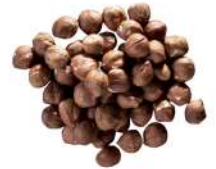
AMBIANT NOISETTES ENTIERES DECORTIQUEES 1KG