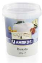
PRODUITS FRAIS BURRATA AMB. POT 200 GR Code: 101261