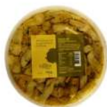
PRODUITS FRAIS ARTICHAUTS ANTIPASTI 1KG Code: 104214