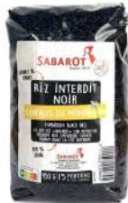
AMBIANT RIZ NOIR 950 GRS SABAROT Code: 203048