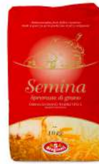
AMBIANT FARINE N°2 SEMINA 10 KGS W340