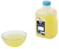
PRODUITS FRAIS BLANC D'ŒUF LIQUIDE 1 KG Code: 102409