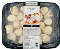
SURGELE BAO JOUES DE PORC 30 G * 24