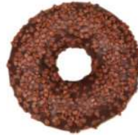
* SURGELE DONUT NOISETTE ET FOURRAGE CREMEUX (36*71 GRS)