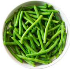
* SURGELE HARICOTS VERTS EXTRA FINS 2.5 KGS Code: 403210