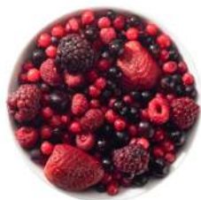
SURGELE FRUITS DES BOIS SUR 450 GRS Code: 404004