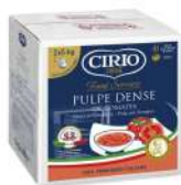
AMBIANT PULPE DENSE TOMATES BBOX 10 KG (2*5) CIRIO Code: 201106