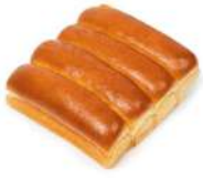
* SURGELE PAIN LOBSTER ROLL 20CM 20X100G Code: 907551