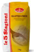
AMBIANT MIX GLUTEN FREE 1 KG