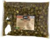
AMBIANT PIMENTS JALAPENOS EMINCES POCHES 3 KGS Code: 807036