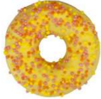
* SURGELE DONUT MANGUE ET FOURRAGE CREMEUX (36*70 GRS)