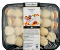
SURGELE BAO CREVETTES CURRY CITRONNE 30 G * 24