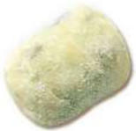
PRODUITS FRAIS GNOCCHI DELLA NONNA 500GR ATM FONTANETO