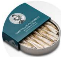
PRODUITS FRAIS SARDINETTES PREMIUM A L'HUILE D'OLIVE 14/18 RO 120 CM