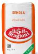
AMBIANT SEMOULE DE GRAIN DUR 10 KGS