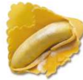
PRODUITS FRAIS GIGANTONE RICOTTA ET ÉPINARDS 2KG SF FONTANETO