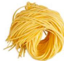
PRODUITS FRAIS SPAGHETTI ALLA CHITARRA 1KG GRANCHEF