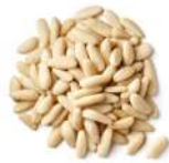
AMBIANT PIGNONS DE PIN 1 KG