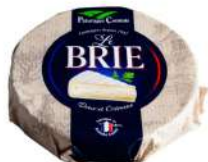
PRODUITS FRAIS BRIE 1KG 60% MG Code: 101418