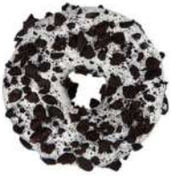
* SURGELE DONUT COOKIE ET FOURRAGE CREMEUX (36*75 GRS)