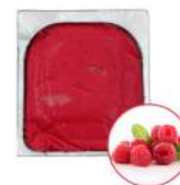
* SURGELE SORBET FRAMBOISE 2.5 L MD