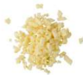
SURGELE AIL SURG 250 GRS Code: 404000