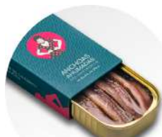
PRODUITS FRAIS ANCHOIS DE CANTABRIE FUMES HUILE OLIVE VIERGE EXTRA RR90 100 G C