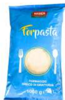
PRODUITS FRAIS GRATTUGIATO RAPE MIX VALCOLATTE 1 KG Code: 101260