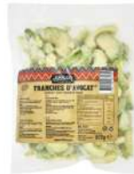
SURGELE TRANCHES AVOCAT *500 G Code: 906723