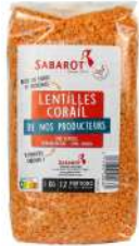
AMBIANT LENTILLES CORAIL 1 KG SABAROT