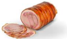
PRODUITS FRAIS PORCHETTA DUCALE DI SUINO SV 5.5 KGS