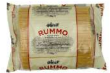
AMBIANT LINGUINE N°13 RUMMO 3 KG