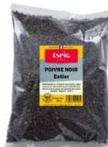
AMBIANT POIVRE NOIR ENTIER 500 GR SACHET ESPIG