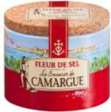
AMBIANT FLEUR DE SEL CAMARGUE 125 GRS