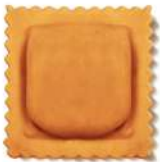
PRODUITS FRAIS QUADRONE CREVETTE CITRON PIMENT 1 KG BARQ GRANCHEF