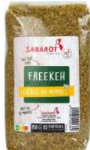
AMBIANT FREEKEH - BLE VERT FUME 850 GRS SABAROT Code: 203050