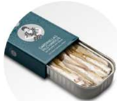
PRODUITS FRAIS SARDINETTES PREMIUM ATLANTIQUE HUILE OLIVE 8/12 MILLESIME 2022