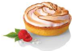
* SURGELE TARTELETTES FRAMBOISINE MERINGUÉE 18*130GR BONCOLAC