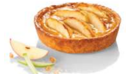
* SURGELE TARTELETTES AUX POMMES 27*130GR BONCOLAC