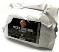
PRODUITS FRAIS JAMBON 1/2 CUIT A LA TRUFFE SORRENT.