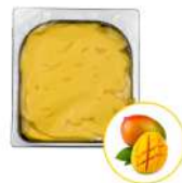
* SURGELE SORBET MANGUE 2.5 L MD