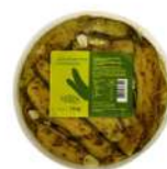
PRODUITS FRAIS COURGETTES GRILLEES ANTIPASTI 1KG Code: 104217