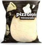
PRODUITS FRAIS MOZZARELLA 40% ALLUMETTES 2 KG