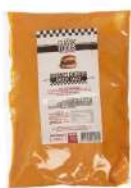
AMBIANT CHEDDAR CHEESE SAUCE 1.42 KGS Code: 807020