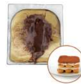
* SURGELE CREME GLACEE TIRAMISU 2.5 L MD Code: 411352