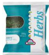
SURGELE ANETH SURG 250 GR Code: 403218