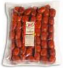
PRODUITS FRAIS MINI CHORIZO FRAIS « PINCHO » A GRILLER FORT 3 KGS LOZA