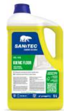
MATERIELS EMBALLAGES HYGIENE NETTOYANT 5 KG DEGRAISSANT SOLS FLEURS ORANGER BERGAMOTE