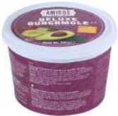
SURGELE DELUXE GUACAMOLE 500 G Code: 906720