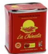
AMBIANT PIMENTON DE LA VERA AOP 350GR COMPTOIR COLONIAL