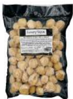
SURGELE MINI CROQUETAS BOEUF SECHE PIMENT 12- 14 G * 72