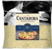
PRODUITS FRAIS MOZZARELLA CANTADORA COSSETTE 2.5KG