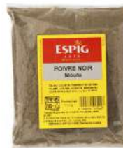
AMBIANT POIVRE NOIR MOULU 1 KG SACHET ESPIG