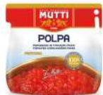
AMBIANT PULPE FINE BIB 2*5 KGS MUTTI Code: 201115