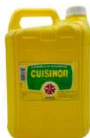
AMBIANT CUISINOR 5 L HUILE DE FRITURE Code: 204308