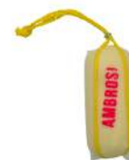
PRODUITS FRAIS PROVOLONE DOUX 800 GR Code: 101237