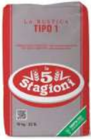
AMBIANT 5 STAGIONI NI PIETRA 10 KGS W380