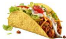
AMBIANT TACOS SHELLS 13 CM SACHETS DE 20