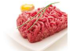
PRODUITS FRAIS TARTARE 180 GRS - 5 % MG VBF SOCOPA