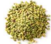
AMBIANT PISTACHE HACHEE 1 KG