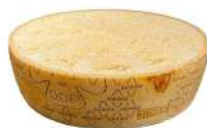
PRODUITS FRAIS GRANA PADANO DOP 1/2 MEULE Code: 101267