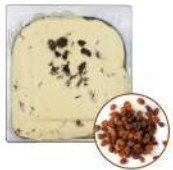
* SURGELE CREME GLACEE MALAGA (RHUM RAISINS) 2.5 L MD Code: 411145