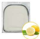
* SURGELE SORBET CITRON 2.5 L MD