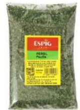
AMBIANT PERSIL FLOCONS 500 GR SACHET ESPIG