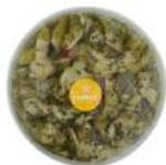
PRODUITS FRAIS ARTICHAUTS QUARTIERS ANTIPASTI 1 KG Code: 104206