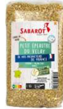
AMBIANT PETIT EPEAUTRE DU VELAY 1KG SABAROT