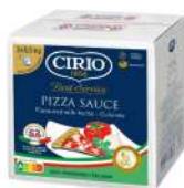
AMBIANT PIZZA SAUCE CIRIO BBOX 2*5.5 KG Code: 201116