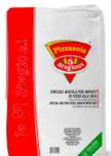
AMBIANT PIZZASOJA 10 KGS 5 STAGIONI