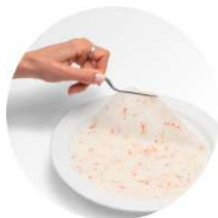
SURGELE ASSIETTE DE CARPACCIO DE CREVETTES GEANTES SAUVAGES CM 55 G BARQ