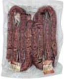
PRODUITS FRAIS CHORIZO COURBE FORT 280GR S/3KG LOZA