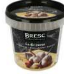
PRODUITS FRAIS PUREE D'AIL 1KG Code: 108007