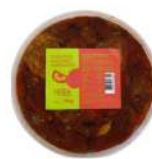
PRODUITS FRAIS TOMATES SECHES ANTIPASTI 1KG Code: 104213