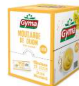
AMBIANT MOUTARDE DE DIJON 250 * 4 GR DOSETTES GYMA