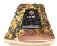
PRODUITS FRAIS SORFUME 3.2 KGS SORRENTINO