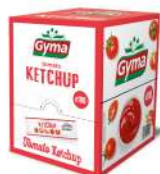
AMBIANT KETCHUP GYMA 100 * 10 ML DOSETTES