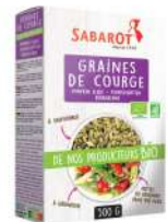
AMBIANT GRAINES DE COURGE BIO 500 GRS SABAROT Code: 203053