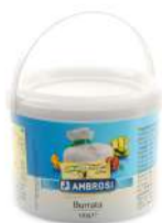
PRODUITS FRAIS BURRATINA AMB. POT 120 G Code: 101201