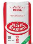
AMBIANT FARINE NAPOLITAINE ROUGE 10 KGS 5 STAGIONI W300