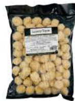
SURGELE MINI CROQUETAS JAMBON IBERIQUE 12- 14 G * 72