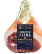
PRODUITS FRAIS JAMBON DE PARME S/OS MARTELLI Code: 103412