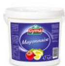
AMBIANT MAYONNAISE GYMA SEAU 4.7 KG