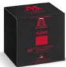
AMBIANT CAFE MIO EXPRESSO X 60 CAPSULES