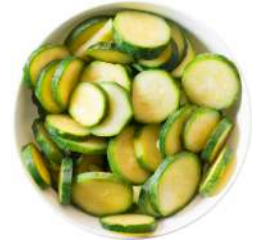
* SURGELE COURGETTES RONDELLES 2.5 KG Code: 403207