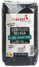
AMBIANT LENTILLES BELUGA NOIRES 1 KG SABAROT