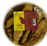
PRODUITS FRAIS AUBERGINES GRILLEES ANTIPASTI 1KG Code: 104218