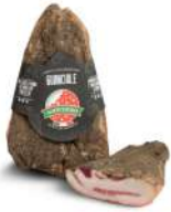
PRODUITS FRAIS GUANCIALE SUINO AU POIVRE 1.5 KG SORRENT.