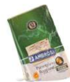
PRODUITS FRAIS PARMIGIANO REGGIANO MEZZANO 1KG Code: 101230