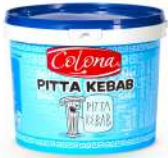
AMBIANT PITTA SPEC. KEBAB SAUCE 5 L Code: 205208