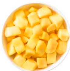
SURGELE MANGUES EN CUBES 20*20 / 1 KG Code: 404007