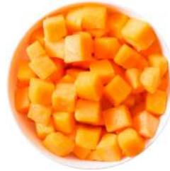
* SURGELE BUTTERNUT CUBES 2.5 KG Code: 403217