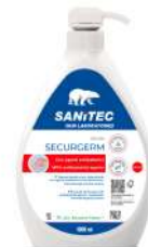
MATERIELS EMBALLAGES HYGIENE SAVON LIQUIDE MAINS BACTERICIDE 1000 ML