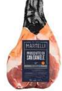
PRODUITS FRAIS JAMBON SAN DANIEL ADDOBBO AOP 18 MOIS Code: 103476