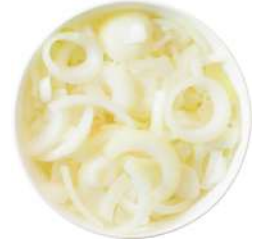
* SURGELE OIGNONS EMINCES SUR 2.5 KGS Code: 403304