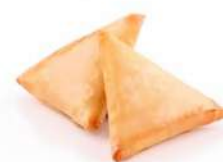
SURGELE SAMOUSSA AUX LEGUMES 100 PIECES Code: 906757