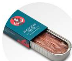
PRODUITS FRAIS ANCHOIS DE CANTABRIE A L'HUILE D'OLIVE VIERGE EXTRA 50 CM