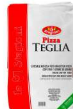
AMBIANT PIZZATEGLIA 10 KGS 5 STAGIONI