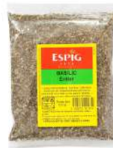
AMBIANT BASILIC FEUILLES 1 KG SACHET ESPIG