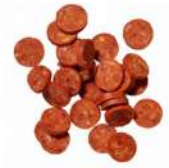
SURGELE MERGUEZ CUITE TRANCHEE 8MM HALAL IQF SOCOPA