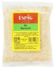
AMBIANT AIL SEMOULE 500 GR SACHET ESPIG