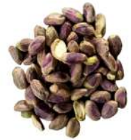
AMBIANT PISTACHES DECORTIQUES 1KG