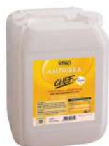
AMBIANT HUILE DE FRITURE AMPHORA CHEF 10L