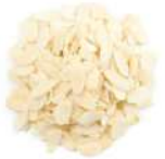
AMBIANT AMANDES EFFILEES BLANCHIES 1 KG