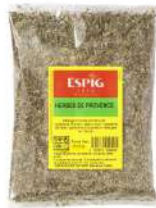
AMBIANT HERBES DE PROVENCE 1 KG SACHET ESPIG