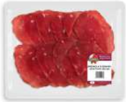
PRODUITS FRAIS BRESAOLA TRANCHE 100 GR SORRENTINO