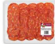
PRODUITS FRAIS SPIANATA PICANTE TRANCHE 100 GR SORRENTINO