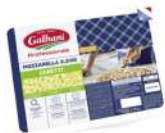
PRODUITS FRAIS MOZZARELLA CUBETTI GALBANI 2.5KG