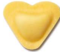
PRODUITS FRAIS CUORICINI AU FROMAGE 1KG SF FONTANETO