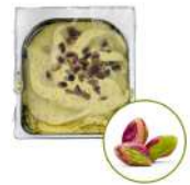
* SURGELE CREME GLACEE PISTACHE DE SICILE 2.5 L MD Code: 411136