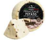
PRODUITS FRAIS PECORINO PRIMOSALE PEPATO FRAIS 1.5 KG