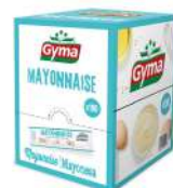
AMBIANT MAYONNAISE GYMA 100 * 10 ML DOSETTES