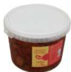
PRODUITS FRAIS TOMATES SECHES ANTIPASTI 3 KG Code: 104220