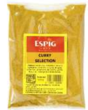
AMBIANT CURRY SELECT 1 KG SACHET ESPIG