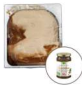
* SURGELE CREME GLACEE NOCCIOLATA 2.5 L MD Code: 411353