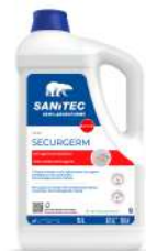
MATERIELS EMBALLAGES HYGIENE SECURGEM SAVON LIQUIDE BACTERICIDE 5 KG