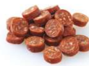
SURGELE MERGUEZ TRANCHEE CUITE SOCOPA