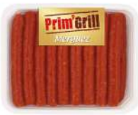
SURGELE MERGUEZ ENVELOPPE VEGETALE SOCOPA 55 G