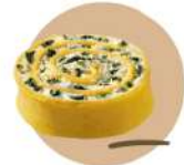
* SURGELE RICCIOLE RICOTTA EPINARDS PRECUTES AUX OEUFS Code: 407229