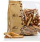
AMBIANT PETITS GRESSINS AU PESTO 300 GR VALLEDORO