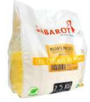
AMBIANT POLENTA EXPRESS 2.5 KG SABAROT