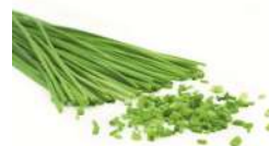
SURGELE CIBOULETTE SURG 250 GRS Code: 404002