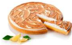
* SURGELE TARTE CITRON MERINGUEE 1KG BONCOLAC