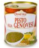
AMBIANT PESTO A LA GENOVESE 4/4 DEMETRA