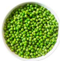
* SURGELE PETITS POIS FINS 2.5 KGS Code: 403214