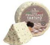
PRODUITS FRAIS PECORINO PRIMOSALE FRAIS TRUFFE 800 GR