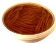
PRODUITS FRAIS BARQUETTE RONDE DE FILETS D'ANCHOIS A L'HUILE 1 KG