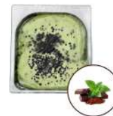
* SURGELE SORBET MENTHE CHOCOLAT 2.5 L MD