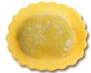
PRODUITS FRAIS DELIZIA HERBES ET PARMESAN 1KG BARQ GRANCHEF