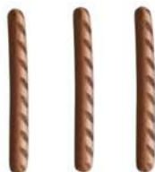
SURGELE SAUCISSE PUR BOEUF MAXI 90GRS * 48 Code: 907353