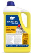
MATERIELS EMBALLAGES HYGIENE LIQUIDE LAVAGE LAVE VAISSELLE 6KG