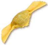
PRODUITS FRAIS CARAMELLA ALLA VIANDE 1KG BARQ GRANCHEF