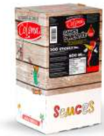
AMBIANT SAUCE PIMENTEE DOSETTES BOITE SERVICE 4 * 200 Code: 204306