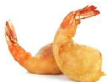
* SURGELE BEIGNETS DE CREVETTES SACHETS DE 500 GRS