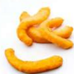
* SURGELE RABAS D'ENCORNET PANES 1 KG