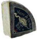
PRODUITS FRAIS NERO DI SICILIA PECORINO SEMISTAGIONATO 1/4 3.8 KG