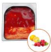
* SURGELE SORBET LAMPONCELLO FRAMB CITRON 2.5L MD