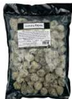
SURGELE MINI CROQUETAS CHIPIRONS A L ENCRE 12- 14 G * 72