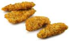
SURGELE GRINGOS CHICKEN CORNFLAKES 1 KG Code: 907449