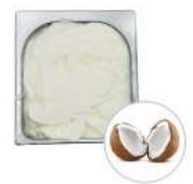
* SURGELE CREME GLACEE NOIX DE COCO 2.5 L MD Code: 411303