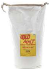
AMBIANT FARINE GOLD MALT 25 KGS 5 STAGIONI