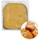
* SURGELE CREME GLACEE CARAMEL BEURRE SALE 2.5 L MD Code: 411143