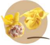
* SURGELE FIOCCHI SPECK E FONTINA SURGITAL 3 KG LABORATORIO Code: 407231