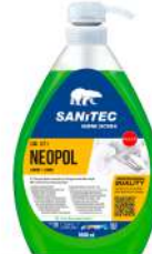
MATERIELS EMBALLAGES HYGIENE NEOPOL VAISSELLE MAIN CITRON 1L ULTRA DEGRAIS.