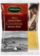
PRODUITS FRAIS CHEDDAR ROUGE RAPE 1 KG Code: 101605