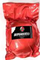
PRODUITS FRAIS JAMBON CUIT SUPERCOTTO SORRENTINO