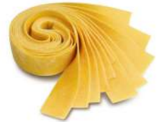
PRODUITS FRAIS PAPPARDELLE 1 KG BARQ GRANCHEF