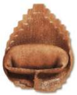
PRODUITS FRAIS TORTELLONE À LA TRUFFE 1KG SF FONTANETO