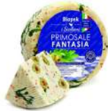
PRODUITS FRAIS PECORINO PRIMOSALE FRAIS FANTASIA 800 GR