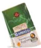
PRODUITS FRAIS PARMIGIANO – REGGIANO 24 MOIS KG DOP Code: 101200