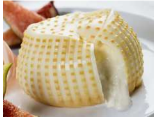
PRODUITS FRAIS BURRATA FUMÉE AMB. 125 G*2 Code: 101202