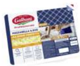
PRODUITS FRAIS MOZZARELLA PERFETTA GALBANI 2.5KG