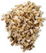
AMBIANT NOISETTES HACHEES GRILLEES 1KG