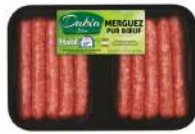
PRODUITS FRAIS MERGUEZ PUR BOEUF HALAL VBF 55 GR *18