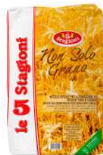
AMBIANT NO SOLO GRANO 10 KGS 5 STAGIONI