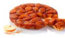
* SURGELE TARTE TATIN « GOURMANDE » 1.22KG BONCOLAC