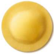
PRODUITS FRAIS DELIZIA RICOTTA ET ÉPINARDS 1KG BARQ GRANCHEF