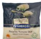
PRODUITS FRAIS PECORINO ROMANO DOP RAPE 500 GR Code: 101508