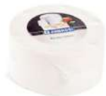
PRODUITS FRAIS RICOTTA SALÉ 3 KGS ENVIRON Code: 101281