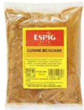
AMBIANT EPICES TEX MEX 240 GR POT ESPIG