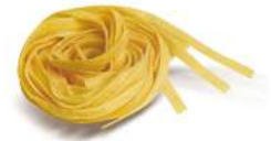
PRODUITS FRAIS TAGLIATELLE MEDIE 2KG SF FONTANETO