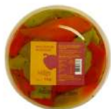
PRODUITS FRAIS POIVRONS GRILLES ANTIPASTI 1 KG Code: 104215