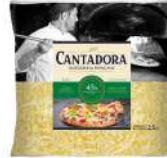
PRODUITS FRAIS MOZZARELLA CANTADORA RAPE 2.5KG