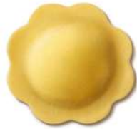
PRODUITS FRAIS FIORE AI FUNGHI PORCINI 1KG SF FONTANETO