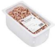
PRODUITS FRAIS LARDONS CRUS SALES 5*5. 1 KG Code: 103205