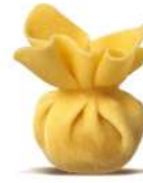
PRODUITS FRAIS SACCOTTINO AU JAMBON CRU 1KG SF FONTANETO