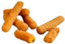
* SURGELE CHEDDAR CHEESE STICKS 1 KG Code: 907349