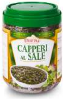
AMBIANT CAPRES AU SEL 1 KG DEMETRA Code: 201315