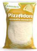
PRODUITS FRAIS MIX MOZZA EMMENTAL JULIENNE 2 KG