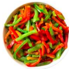
* SURGELE POIVRONS ROUGES VERTS LANIERES SUR 2.5 KGS Code: 403306