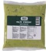
SURGELE PULPE D'AVOCAT SACHET 1 KG Code: 906721