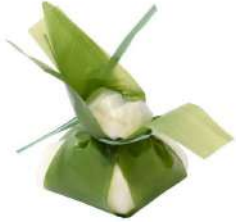
PRODUITS FRAIS BURRATA FEUILLE AMB. BARQUETTE 250 G Code: 101246