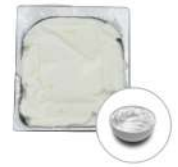
* SURGELE CREME GLACEE FIOR DI PANNA(LATTE) 2.5 L MD Code: 411140