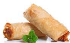
SURGELE NEM AU PORC 2*50P Code: 904873