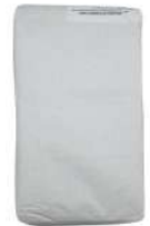
AMBIANT FARINE AVEC GERME DE BLE 10 KG