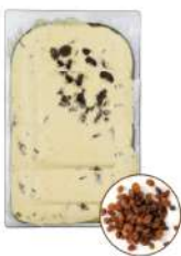
* SURGELE CREME GLACEE RHUM /RAISIN (MALAGA) 5 L MD Code: 411326