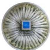
PRODUITS FRAIS ANCHOIS ARGENTS MARINES A L HUILE 1 KG Code: 104221