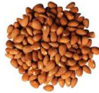
AMBIANT AMANDES ENTIERES DECORTIQUEES 1KG