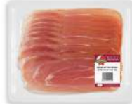
PRODUITS FRAIS JAMBON CRU TRANCHE ITALIEN 500 GRS