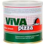
AMBIANT VIVA PIZZA LEVURE DESY 500 GRS