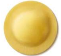
PRODUITS FRAIS DELIZIA CITRON 1KG SF FONTANETO