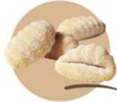
* SURGELE GNOCCHI DE POMME DE TERRE SURGITAL LINEA AZZURA 1 KG Code: 409111