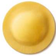
PRODUITS FRAIS DELIZIA À LA TRUFFE 1KG BARQ GRANCHEF