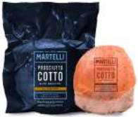
PRODUITS FRAIS JAMBON CUIT A LA TRUFFE 1/2 MARTELLI Code: 103413