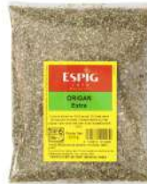
AMBIANT ORIGAN EXTRA 750 GR SACHET ESPIG