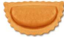
PRODUITS FRAIS MEZZALUNA BURRATA TOMATE ET BASILIC GRANCHEF