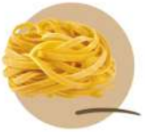
* SURGELE TAGLIOLINE AUX OEUFS 1.5 KG SURGITAL - GAMME LABORATORIO Code: 407106