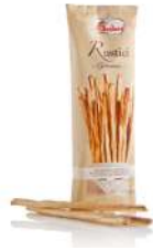
AMBIANT GRESSINS RUSTIQUES RESTAU. 240 GR