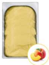
* SURGELE SORBET PECHE 5 L MD