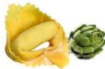
PRODUITS FRAIS TORTELLONE ARTICHAUTS 1 KG BARQ FONTANETO