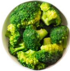
* SURGELE BROCOLIS 2.5 KGS Code: 403208