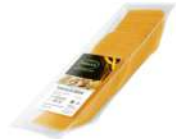
PRODUITS FRAIS CHEDDAR ROUGE TRANCHES 9*9 1KG Code: 101610