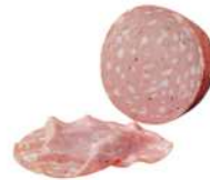
PRODUITS FRAIS MORTADELLE A LA TRUFFE 1/2 5.5 KGS