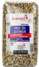
AMBIANT TRIO DE QUINOA 1KG SABAROT