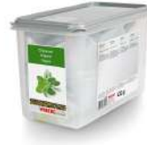
AMBIANT ORIGAN SÉCHÉ WIBERG 7900 ML