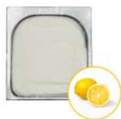
* SURGELE SORBET LIMONCELLO 2.5 L MD