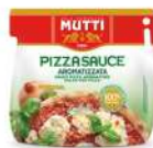
AMBIANT SAUCE PIZZA AROMATISEE BIB 2*5 KGS MUTTI Code: 201117