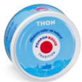
AMBIANT THON ENTIER NATUREL OF 1/6 Code: 201500