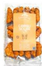
AMBIANT CANNOLINI SICILIENS MIGNONS *16 Code: 208232