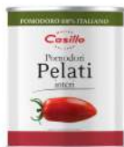
AMBIANT TOMATES PELEES 3/1 CASILLO Code: 201128