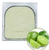
* SURGELE SORBET CITRON VERT 2.5 L MD