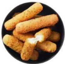
* SURGELE PREMIUM MOZZARELLA STICKS 1 KG Code: 906740