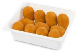
PRODUITS FRAIS ARANCINI GORGONZOLA 2*11 FONTANETO