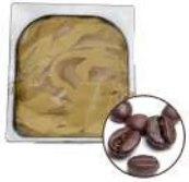
* SURGELE CREME GLACEE CAFE 2.5 L MD Code: 411137