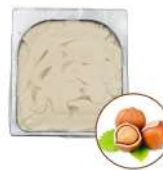
* SURGELE CREME GLACEE NOISETTE 2.5 L MD Code: 411139