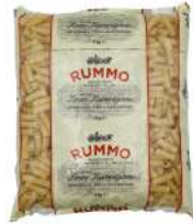
AMBIANT ELICOIDALI N° 49 RUMMO 3 KG