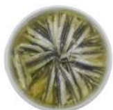
PRODUITS FRAIS ANCHOIS ARGENT MARINES A L HUILE 1 KG Code: 104211