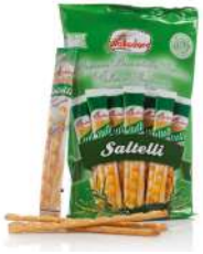
AMBIANT GRESSINS ROMARIN 240 GR SALTELLI