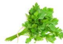
SURGELE PERSIL SUR 250 GRS Code: 404006