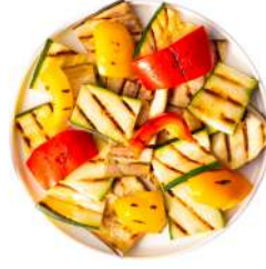
* SURGELE MIX LEGUMES GRILLES SICILIANO 1 KG Code: 403209