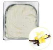
* SURGELE CREME GLACEE VANILLE MAD. 2.5 L MD Code: 411135