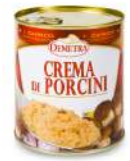
AMBIANT CREME DE CEPES 4/4 DEMETRA