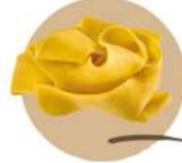
* SURGELE PAPPARDELLE 1.5 KG SURGITAL - GAMME LABORATORIO Code: 407219