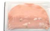
PRODUITS FRAIS MORTADELLE TRANCHE 500 GRS (30 TRANCHES) (Ø 15 CM) AZZOLA