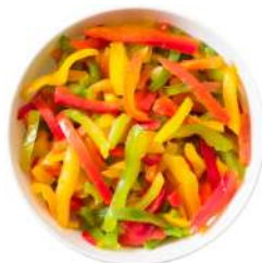
* SURGELE POIVRONS ROUGES VERTS ET JAUNES LANIERES SUR 2.5 KGS Code: 403305