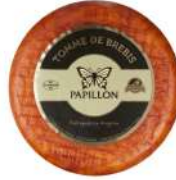
PRODUITS FRAIS TOMME DE BREBIS 4.5KG PAPILLON Code: 101519