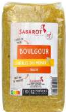
AMBIANT BOULGOUR MOYEN 1KG SABAROT Code: 203052