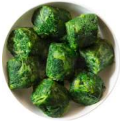
* SURGELE EPINARDS BRANCHE 2.5 KGS – PORTION 35 G Code: 403206