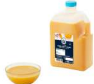
PRODUITS FRAIS JAUNE D'ŒUF LIQUIDE 1 KG Code: 102408