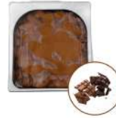
* SURGELE CREME GLACEE CHOCOLAT 2.5 L MD Code: 411134