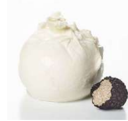
PRODUITS FRAIS BURRATA TRUFFE AMB. 125 G*2 Code: 101205